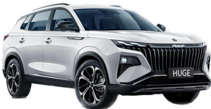
HUGE - HÍBRIDO