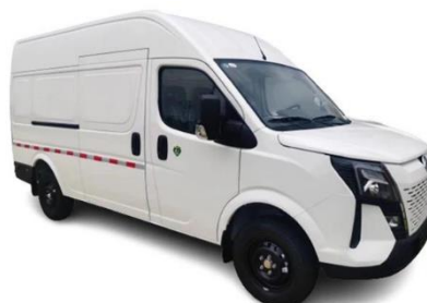
MICROBÚS K33 PANEL K33