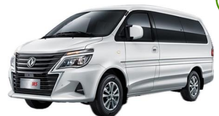
MICROBÚS M5 PANEL M5