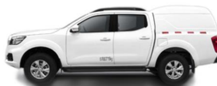
PICK-UP RICH6 CON CARRYBOY