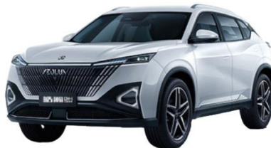
MAGE - HIBRIDO